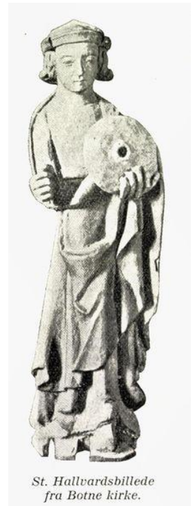
St. Hallvardsbillede fra Botne kirke.

Billedframstillinger av Hallvard finnes på alterskap i kirkene i Onsøy, Ringsaker og Balke. Takdekorasjoner i Vang stavkirke fra Valdres viser Hallvard legenden. Best kjent av St. Hallvard statuene er trefigurene fra Botne kirke. Her fremstilles St. Hallvard som en unggutt med en kvernstein i hånden.