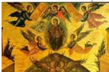
Jomfru Marias opptagelse i himmelen