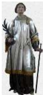
Den hellige Laurentius