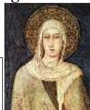
Den hellige Klara av Assisi