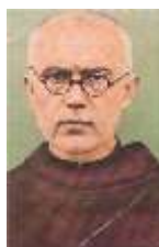
Den hellige Maximilian Kolbe