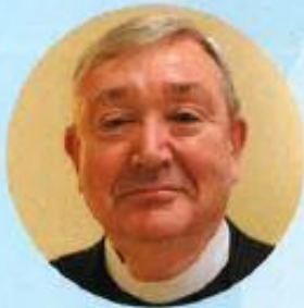
Biskop Bernt Eidsvig: Katolsk innvandring i Norge